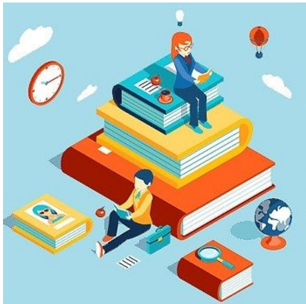
Figura 3: Miniatura em formato de imagem.