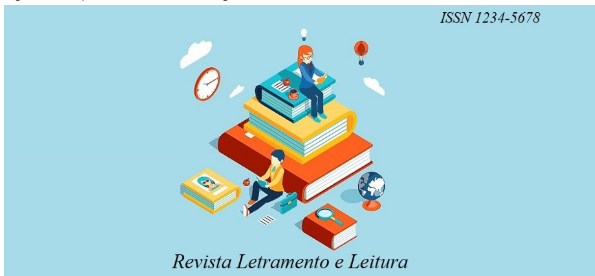
Figura 2: Capa em formato de imagem.