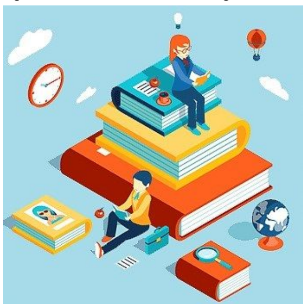
Figura 4: Ícone em formato de imagem.