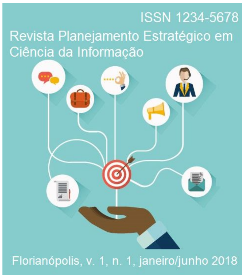
Figura 5: Capa da edição.

A capa representa os textos abordados de acordo com a temática escolhida para a edição atual.