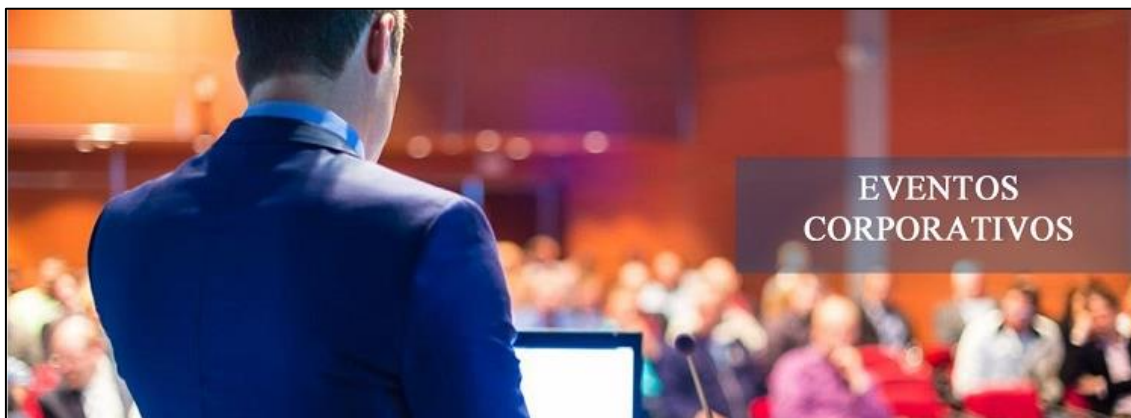
Figura 3: Capa da Revista

Para a imagem da capa da revista, foi selecionado uma foto bem representativa de eventos.