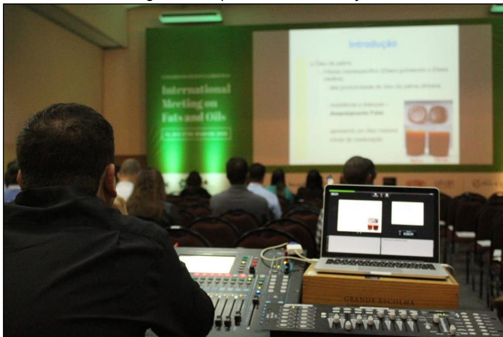
Figura 4: Capa da Primeira Edição