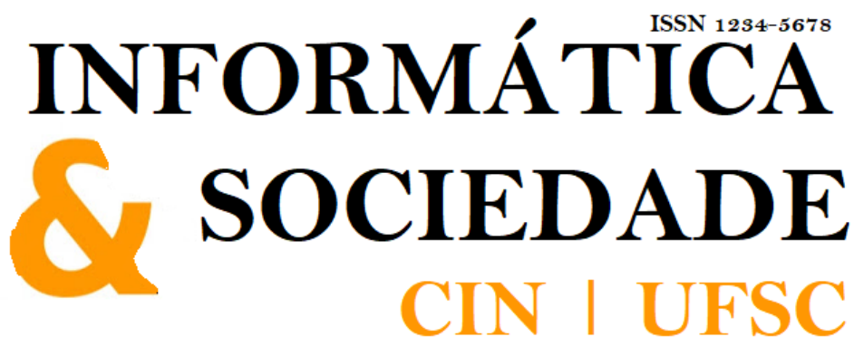
Figura 1 – Cabeçalho

A Revista possui um cabeçalho onde foi relatado o nome da revista e seu registro