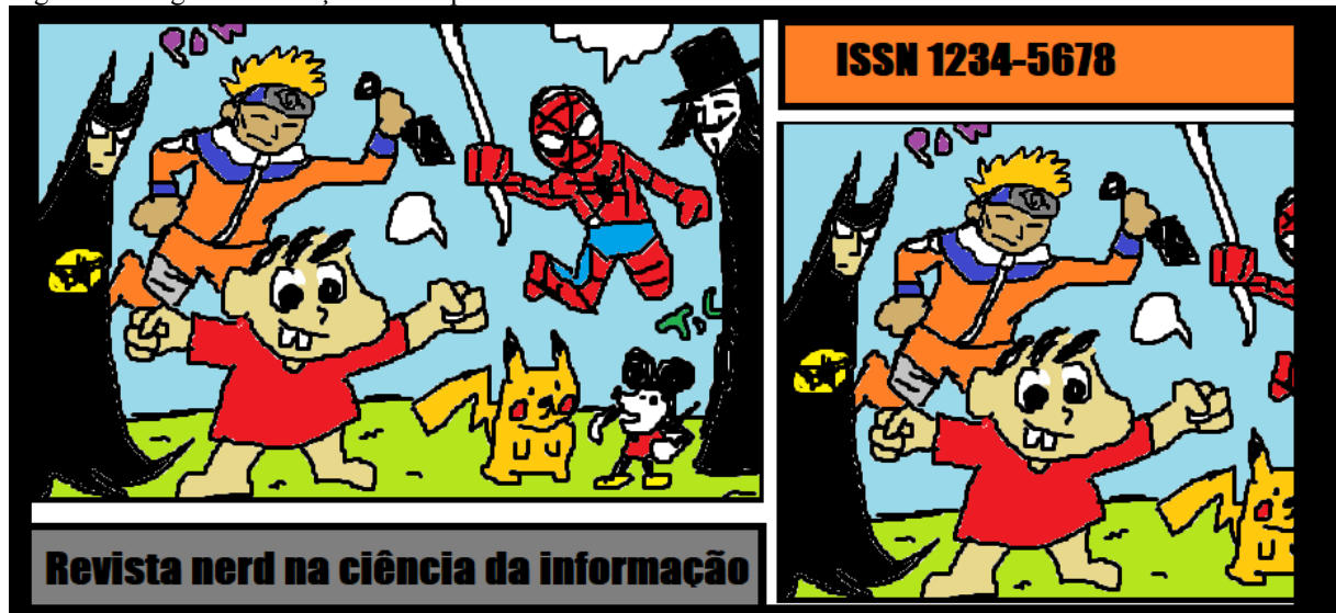
Figura 1- Imagem do cabeçalho da capa