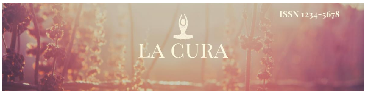
Figura 3 - Cabeçalho da capa da revista

O cabeçalho da capa foi feito através da ferramenta Canvas.