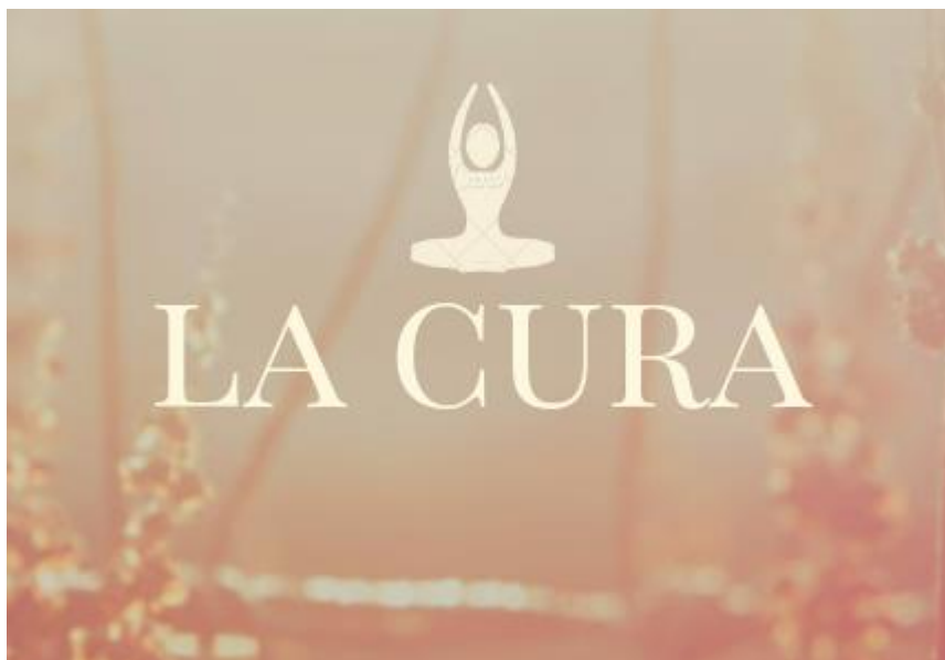
Figura 4 – Logotipo da Revista

O logotipo da revista foi criado com base no cabeçalho de capa.