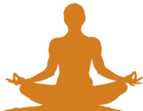
Figura 5 – Ícone de favoritos

O ícone de favoritos a ser exibido na barra de endereço do navegador foi selecionado com base nas cores escolhidas para revista,