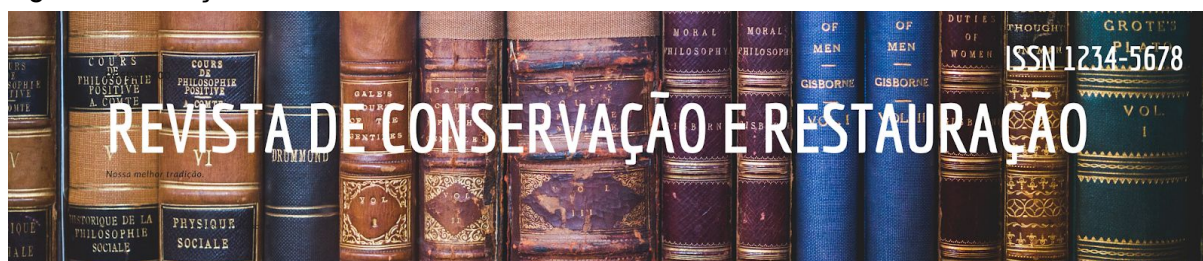
Figura 1: Cabeçalho

A imagem de cabeçalho da capa da revista apresenta o nome da mesma e o seu ISSN