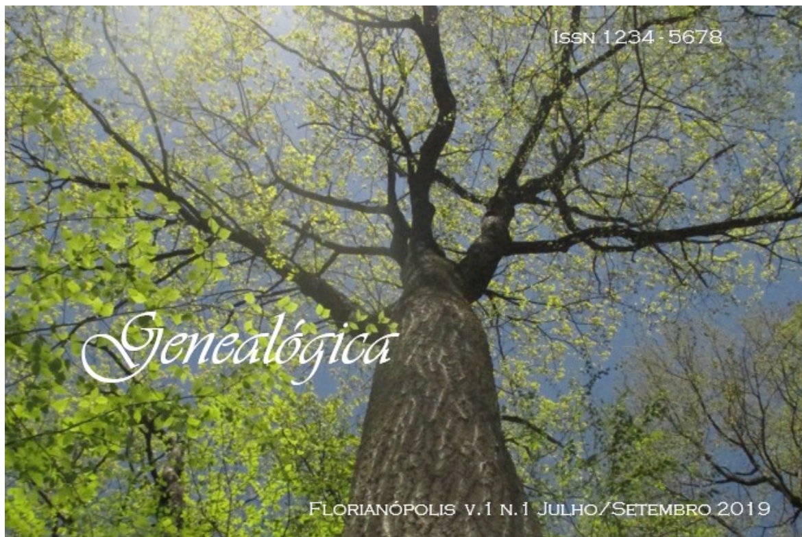
Figura 3 Capa da Edição

A Capa da edição segue as normas da ABNT com a inscrição do ISSN no canto superior direito e o local, volume, número e data no final da figura.