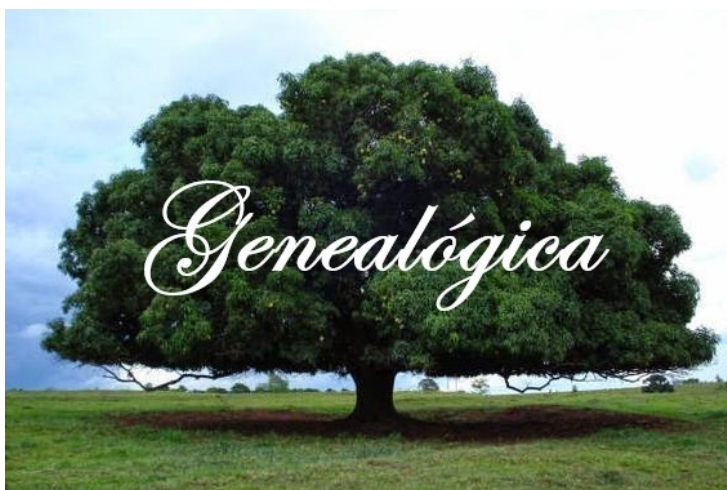
Figura 2: Miniatura

A figura de uma árvore frondosa representa a Genealógica em miniatura.