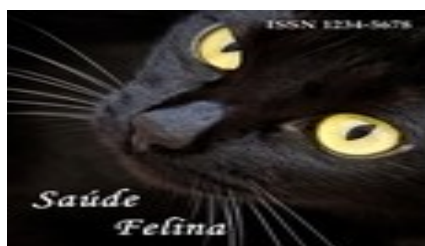
Figura 2 - Miniatura e capa da revista