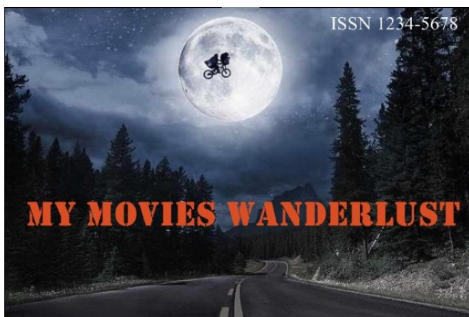
Figura 4 – Miniatura e capa da revista

A seguir apresenta a miniatura elaborada para complemento do visual da revista, que foi utilizada também como capa da revista.