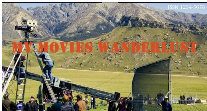
Figura 3 - Cabeçalho

A Revista possui um cabeçalho onde foi relatado o nome da revista e seu registro