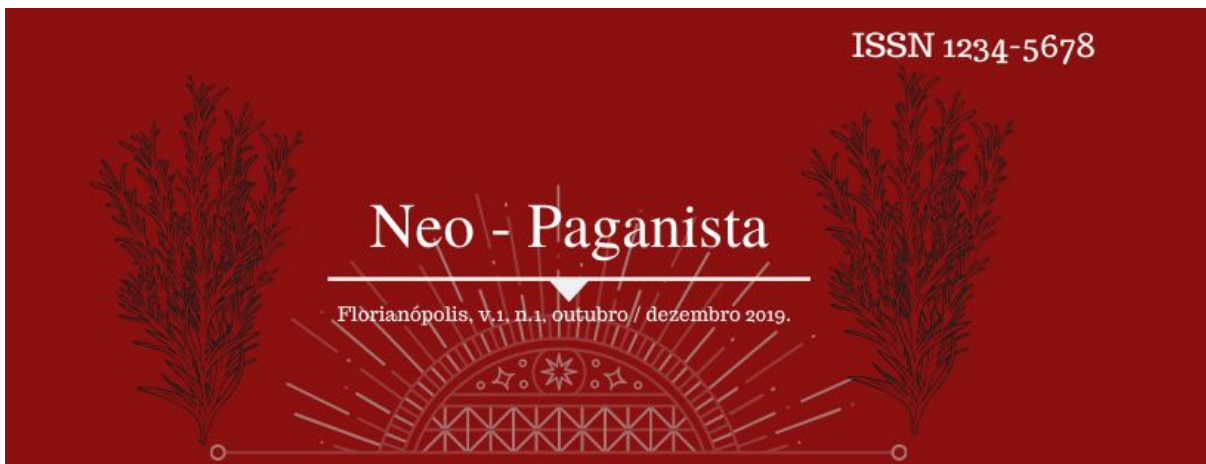
Figura 3: Capa da primeira edição da revista

A seguir, a capa da primeira edição da Neo-Paganista.