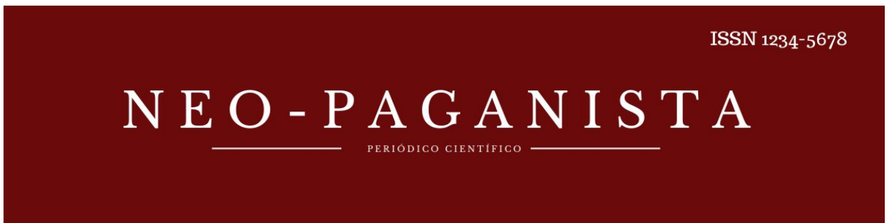
Figura 1: Cabeçalho

A imagem de capa da revista possui uma foto que contém o nome da revista.