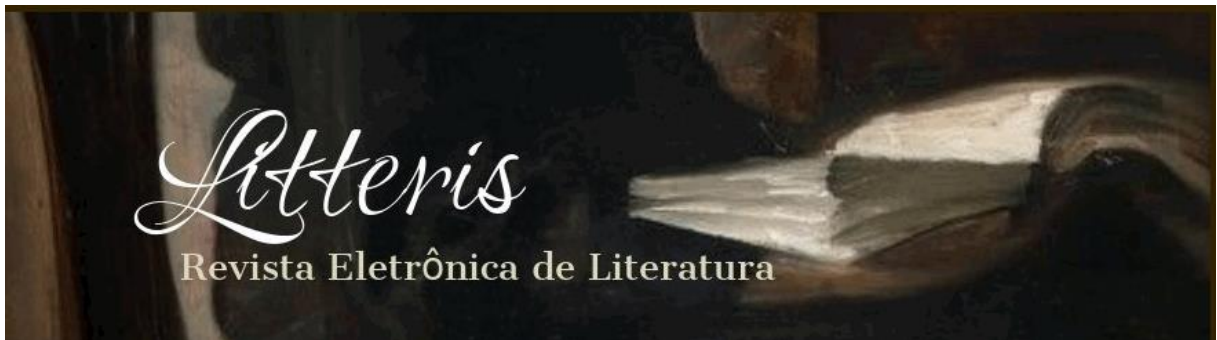
Figura 1 - Cabeçalho

A imagem do cabeçalho da revista possui uma foto com o nome da revista.