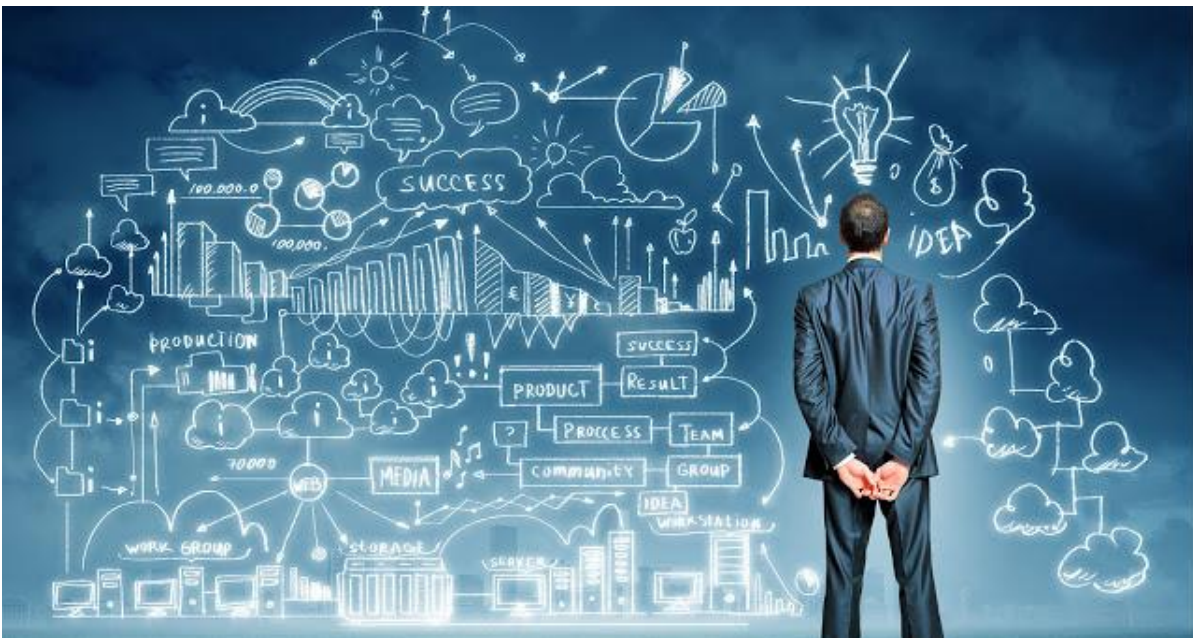
Figura 3: Capa da revista

A capa da revista ilustra o a temática central de seu conteúdo: a ciência da informação como área de atuação profissional.