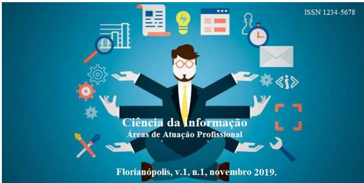
Figura 4: Capa da Edição