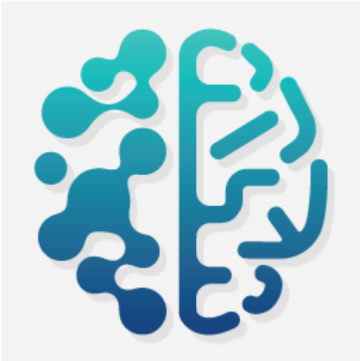
Figura 2: Miniatura