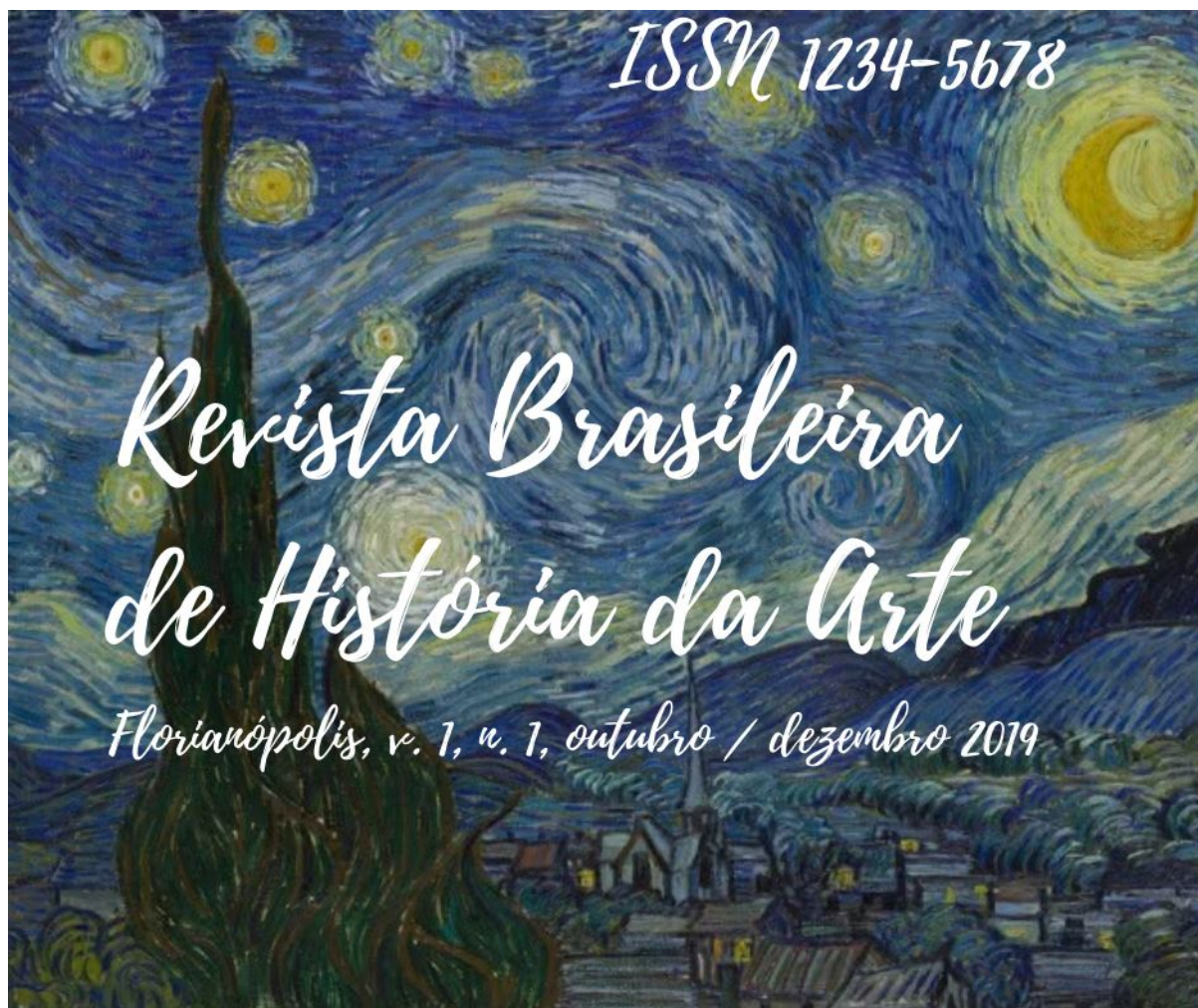
Figura 3: Capa da primeira edição da revista

A seguinte imagem foi utilizada como capa para a primeira edição da Revista Brasileira de História da Arte: