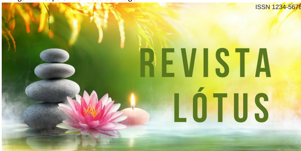
Figura 1: Capa em formato de imagem