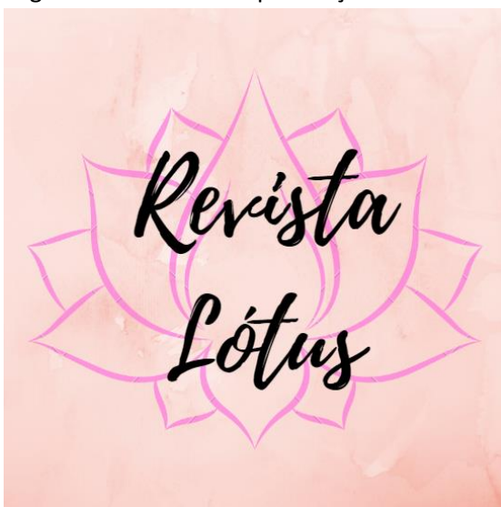
Figura 2: Miniatura da publicação